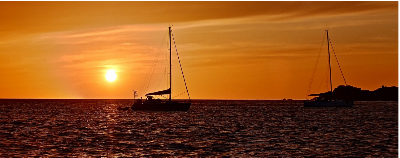
Der Sonnenuntergang liess alles vergessen ...