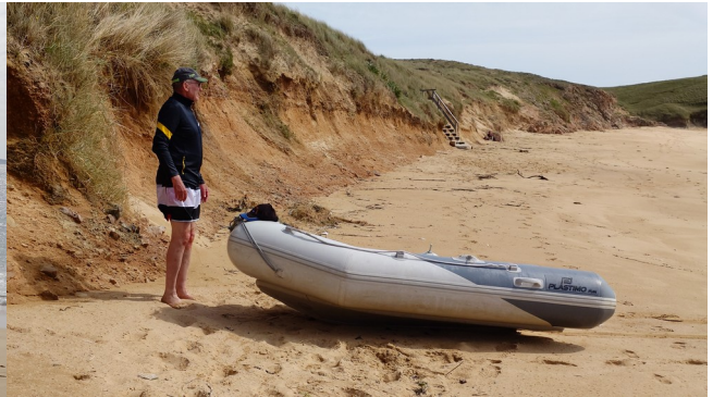
... wurden unsere Felle nass ...