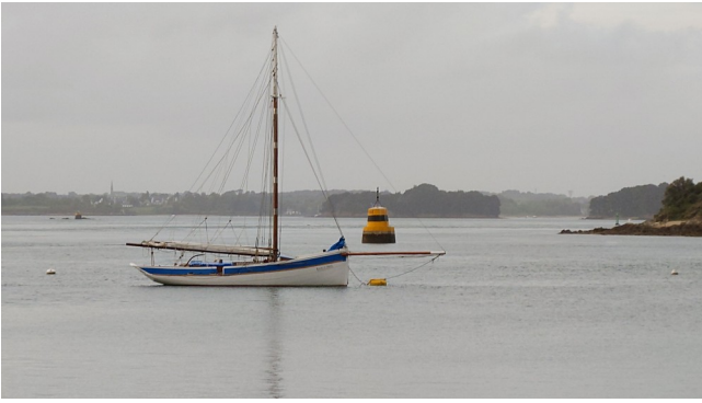
Blick Richtung Morbihan