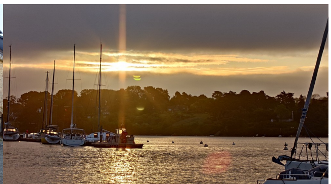
auf der Ile-aux-Moines