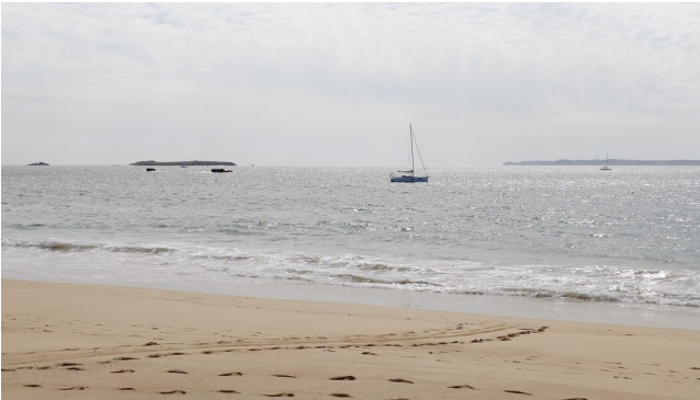
An diesem Strand ...