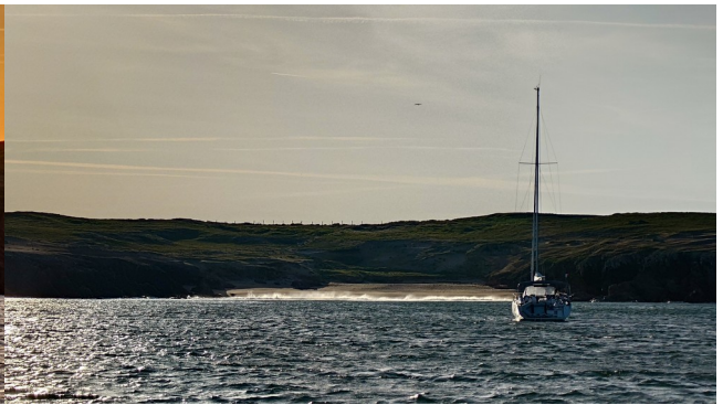
Sonnenaufgang über Houat