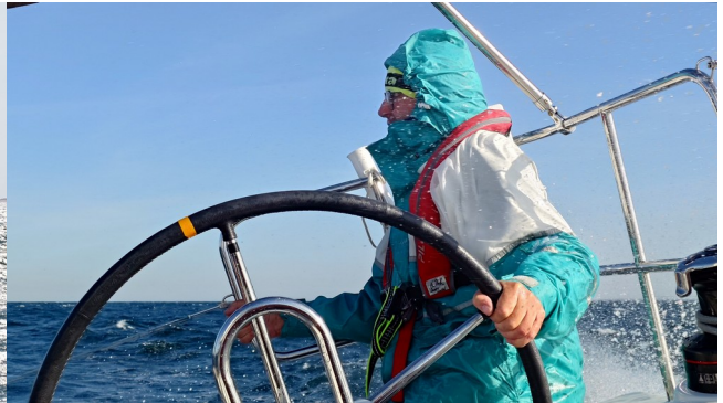
... und Capitano testet das grün-weiße ...