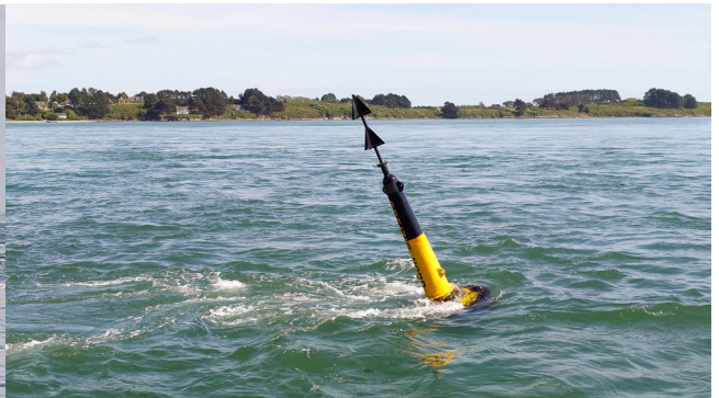
Der Morbihan, wie ein Fluss ...