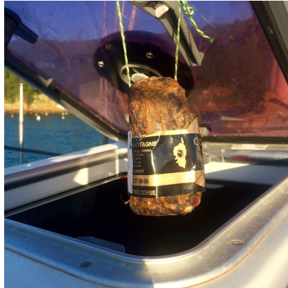
Capt'n Blaubär's Fleischtrocknerei