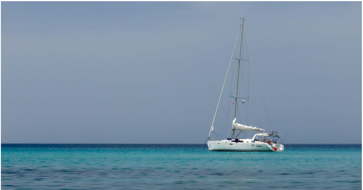
Plage Saleccia auf Korsika