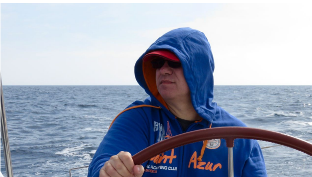
The 'dark side of the force'