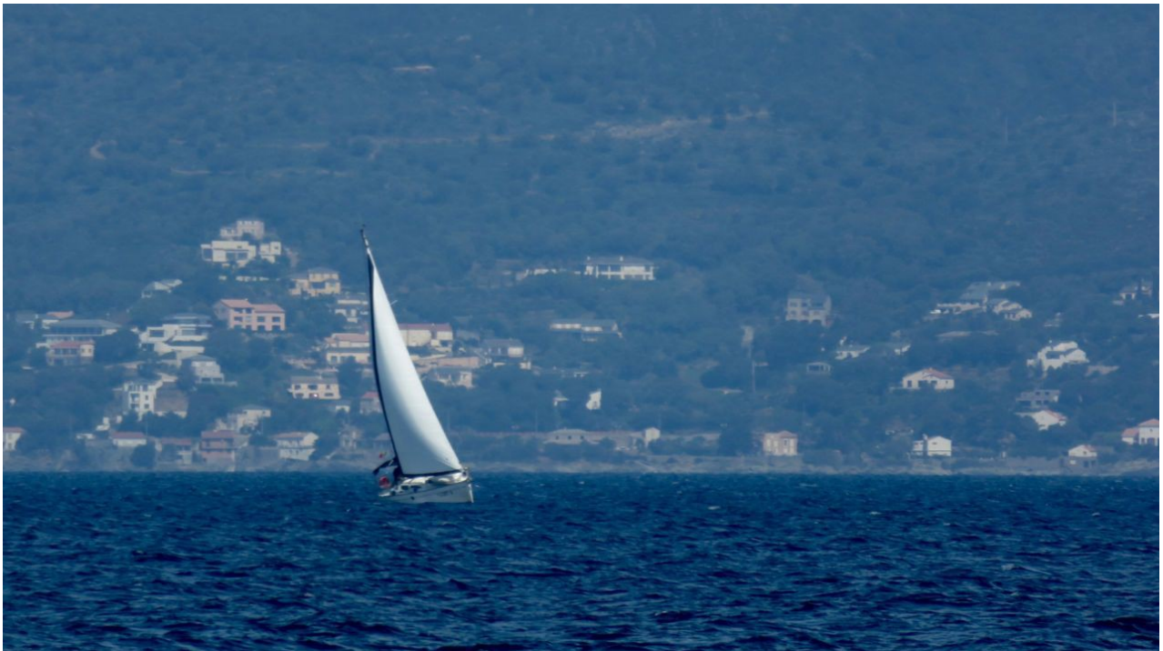
WD7-Crew nach unserer 2. Begegnung