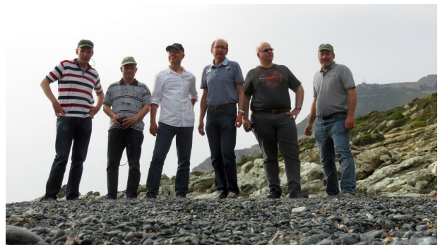
Unsere Crew auf dem von Capitano Ufo organisierten Landgang