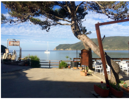
Lacona Beach auf Elba