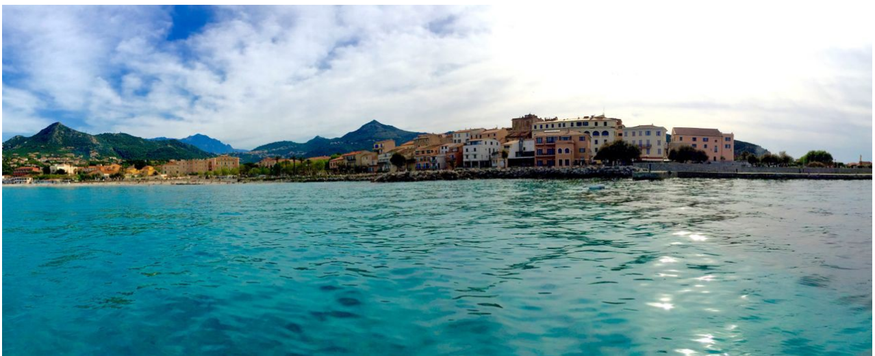
Ile Rousse by Mike