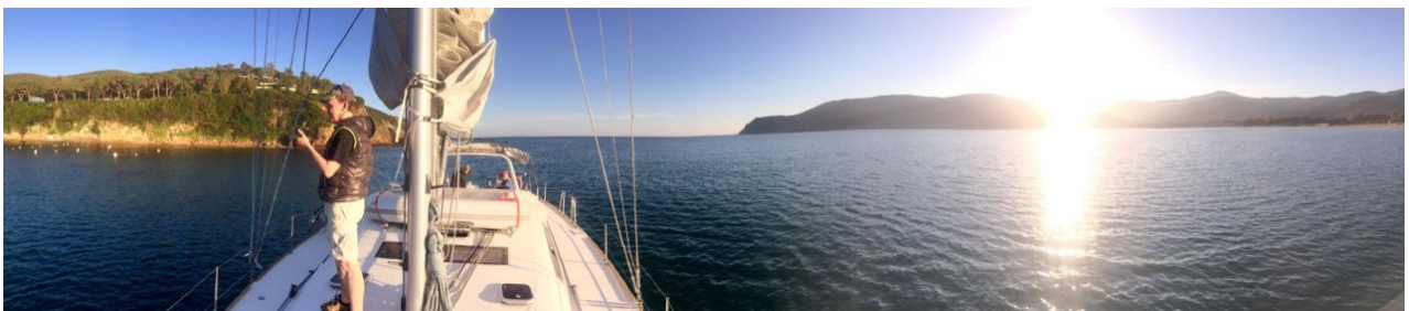
Golfo della Lacona auf Elba