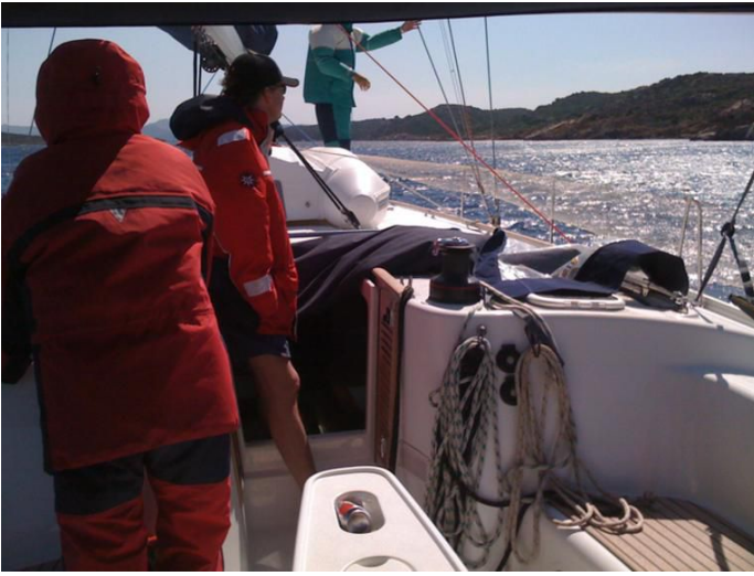
Einfahrt in den Fjord von Bonifacio